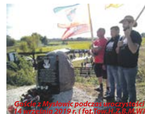
Goście z Mysłowic podczas uroczystości 14 września 2019 r.

głównie dzieci i młodzież do działań propagujących historię regionu by świadomość korzeni rodzinnych nie była bezimienna.