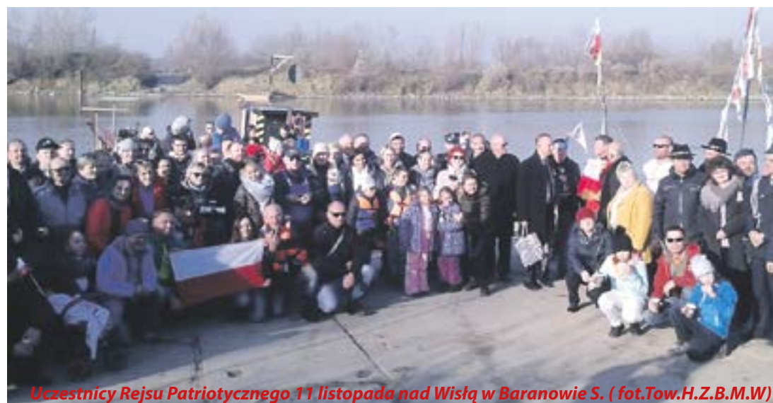
Uczestnicy Rejsu Patriotycznego 11 listopada nad Wisłą w Baranowie S.