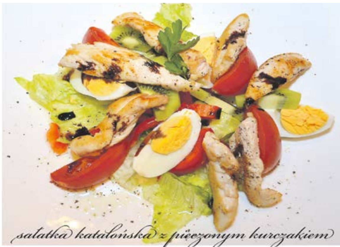
sałatka katalońska z pieczonym kurczakiem