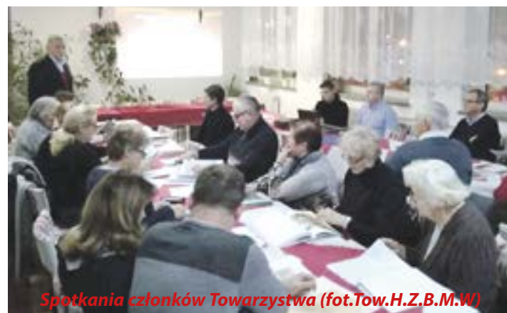
Spotkania członków Towarzystwa

nymi pozyskanymi materiałami. Spotkania członków Towarzystwa odbywają się cyklicznie co kilka miesięcy, szczególnie w jesienne i zimowe wieczory. Organizowane są wówczas prelekcje historyczne oraz prezentacje ciekawych materiałów, starych fotografii