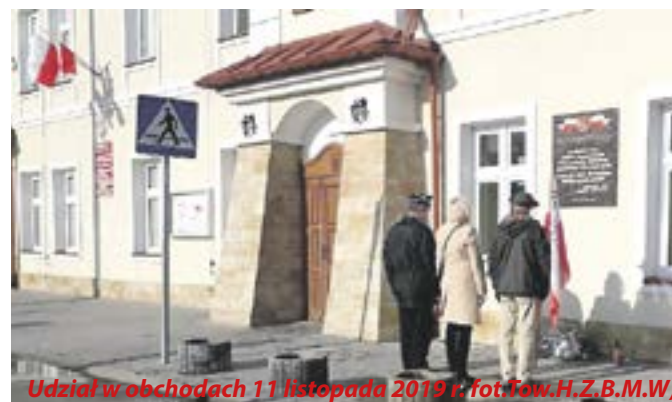
Udział w obchodach 11 listopada 2019 r.